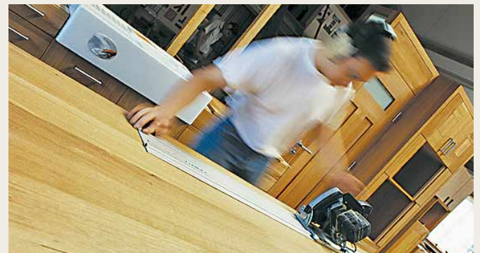
Selbstständige bekommen schneller einen Hauskredit: Tischler und andere Gewerbetreibende fanden dafür bislang bei Banken nur selten Gehör