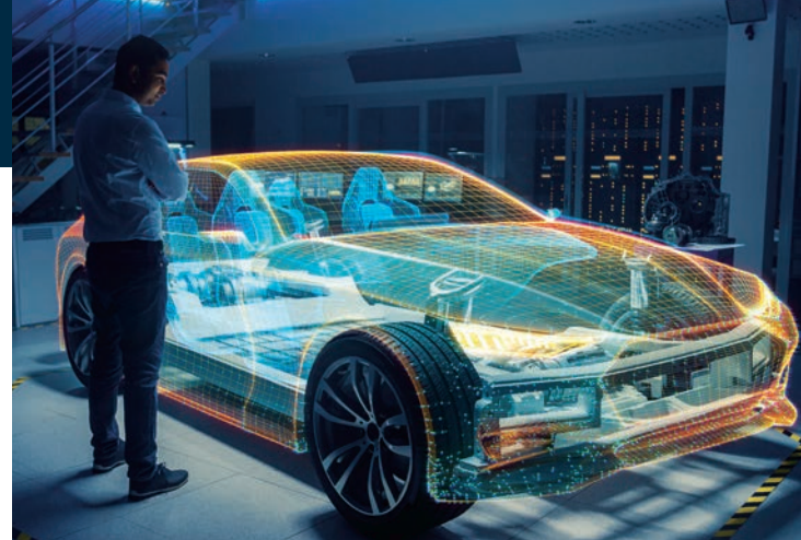
Automobilentwicklung Hyundai steht für höchste Innovationskraft